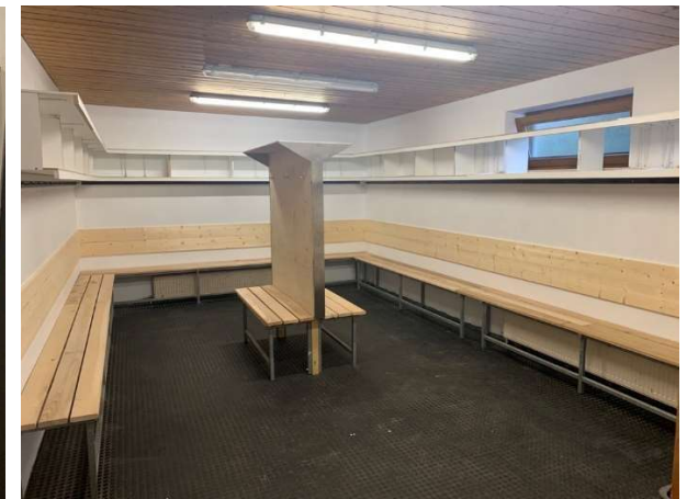
Heimkabine 2 oder Schiedsrichterkabine bei 4 Schiedsrichter