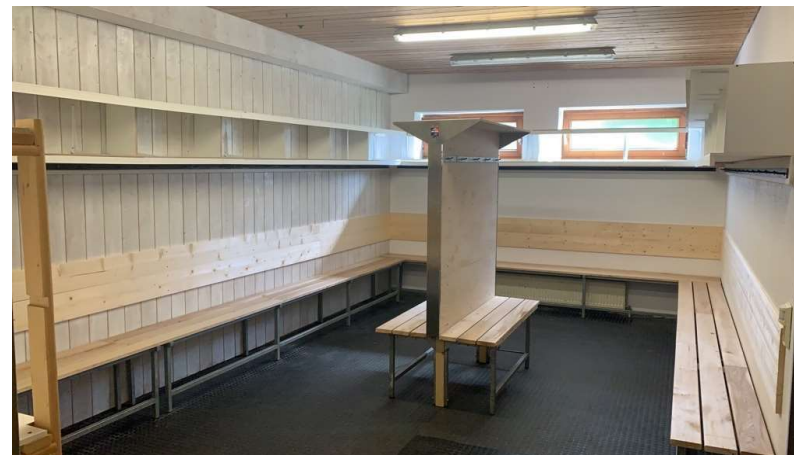
Heimkabine 1 oder Schiedsrichterkabine bei 4 Schiedsrichter