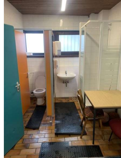
Schiedsrichterkabine bei 2 und 3 Schiedsrichtern